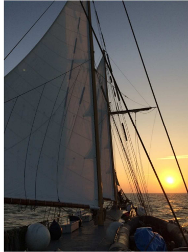
Här seglar vi!