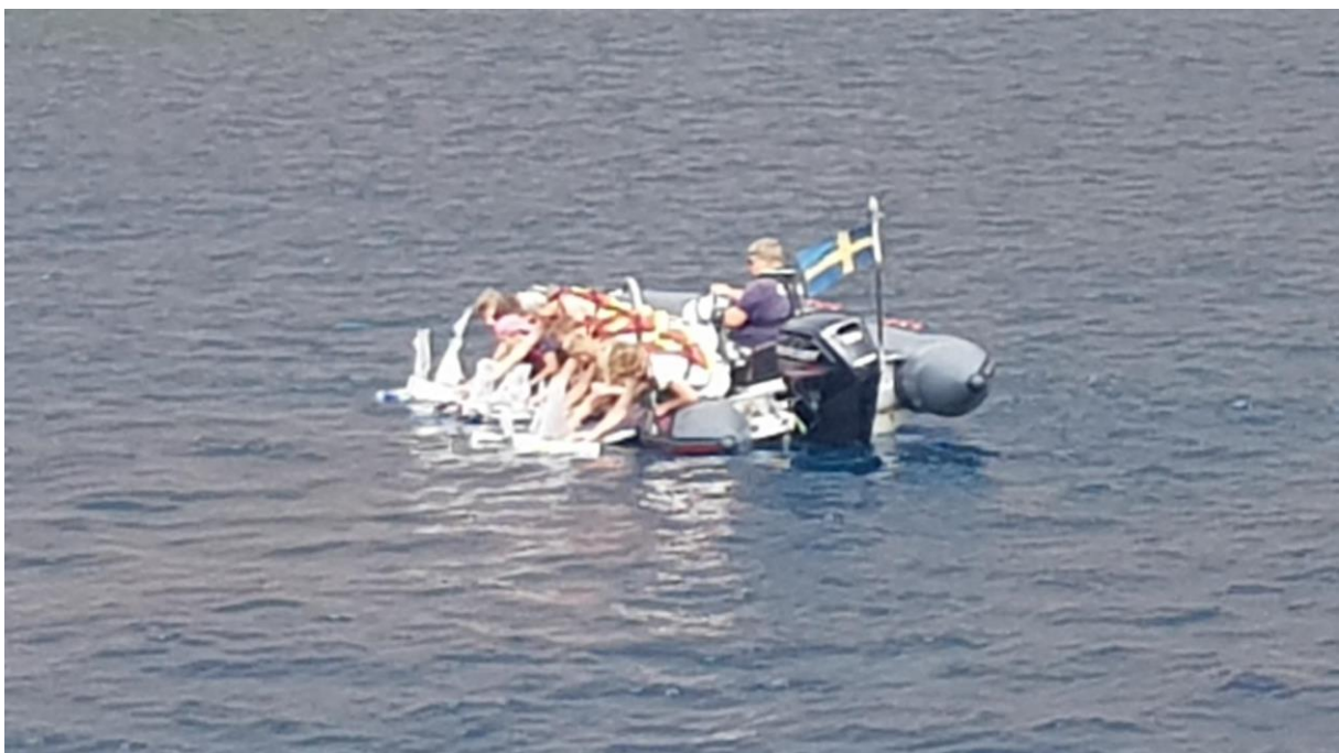
Sjösättning av båtarna från Ribben