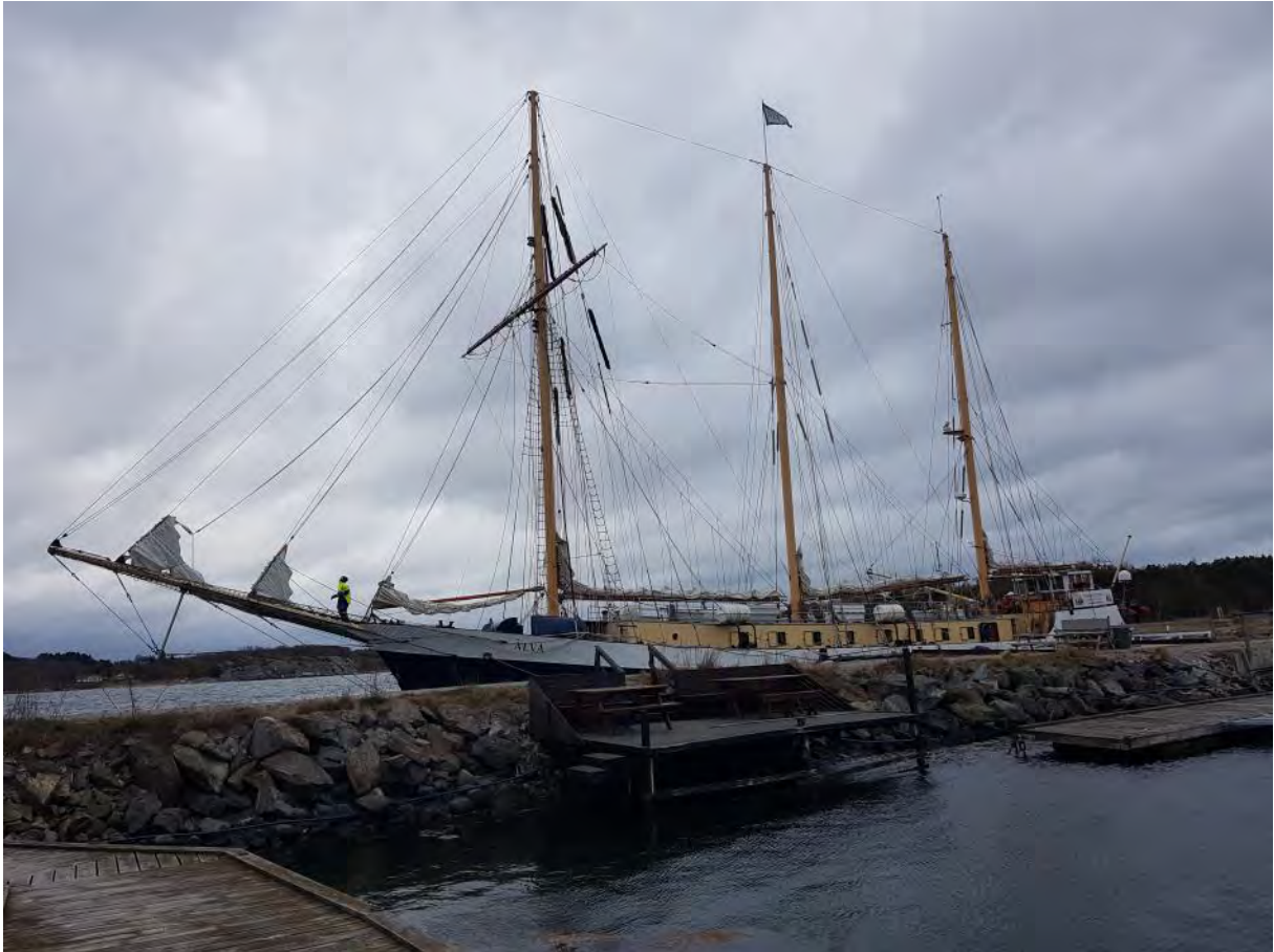
Blåsiget väder här på Kosteröarna