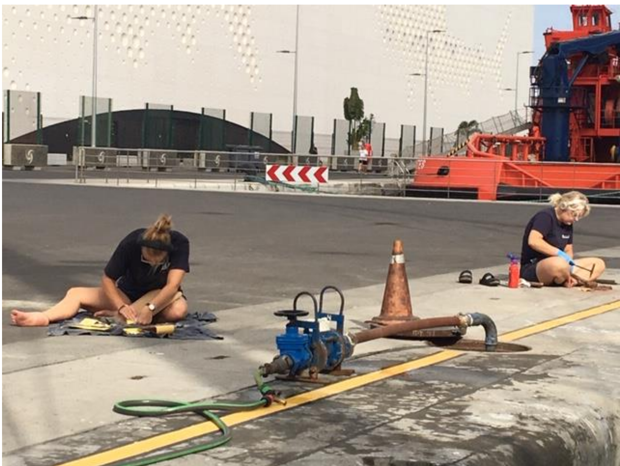
Flitiga matrosknackar rost i väntan på att sätta igång med förtrogenhetsutbildningen

Sverige är ett fantastiskt land på många sätt. Storföretagen, innovationskraften, unga människors möjligheter att plugga och göra det man brinner för. YH-utbildningen och Älva är bra exempel. I den unge och spanske styrmannens tankar finns dock mest världens bästa fotbollsspelare. Trots att han är svensk och trots att han spelar för Milan. Tänk om begåvningsreserven som sågar ner statyn i Malmö kunde förstå storheten i fotbollen och hos de som verkligen vill något. Som vågar gå sin egen väg. Kanske lite likt de 29 YH-elever som nu är ombord för att lära och uppleva sin dröm. Att vara en del av en besättning på ett stort segelfartyg ute på Atlanten. Nu när vi alla är på plats börjar både allvaret och allt det roliga.