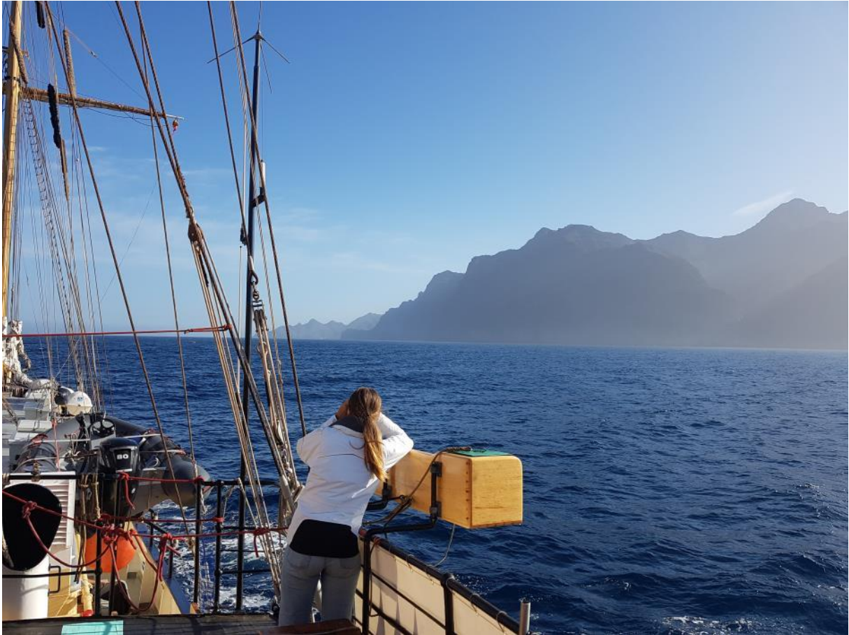
Skärpt utkik nära kusten då fiskebojar och nät kan vara ett problem