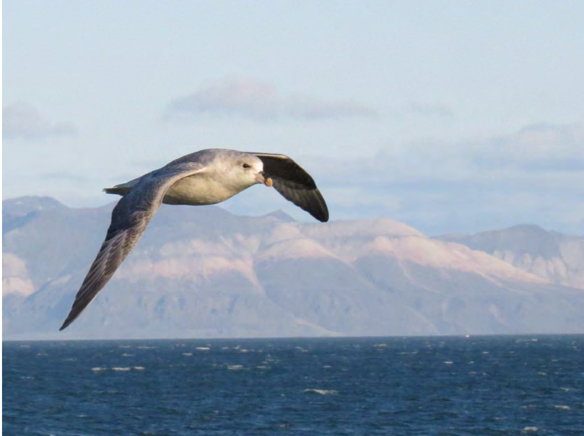
Stormfågel i sin rätta miljö