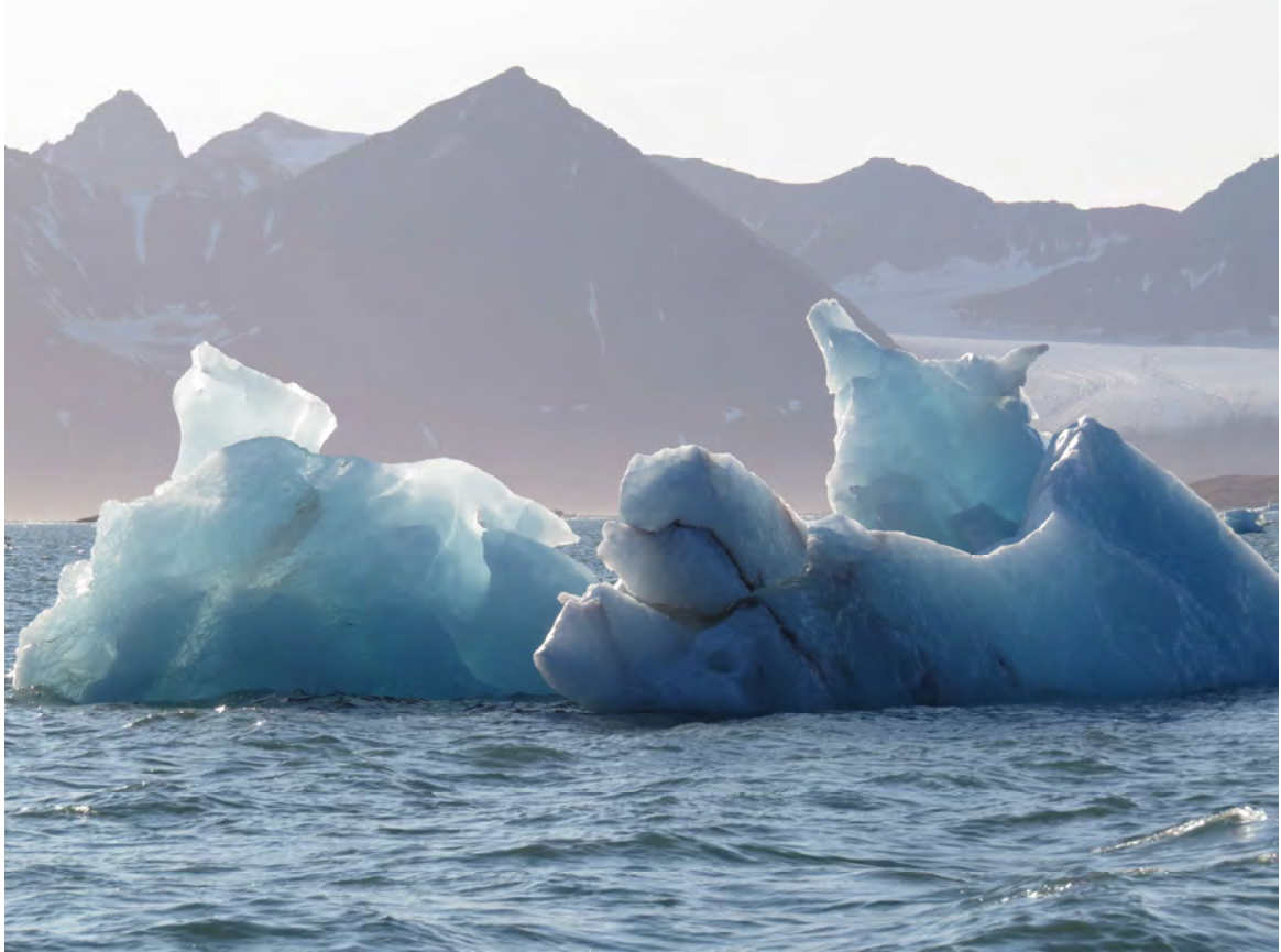
Isberg alldeles intill båten