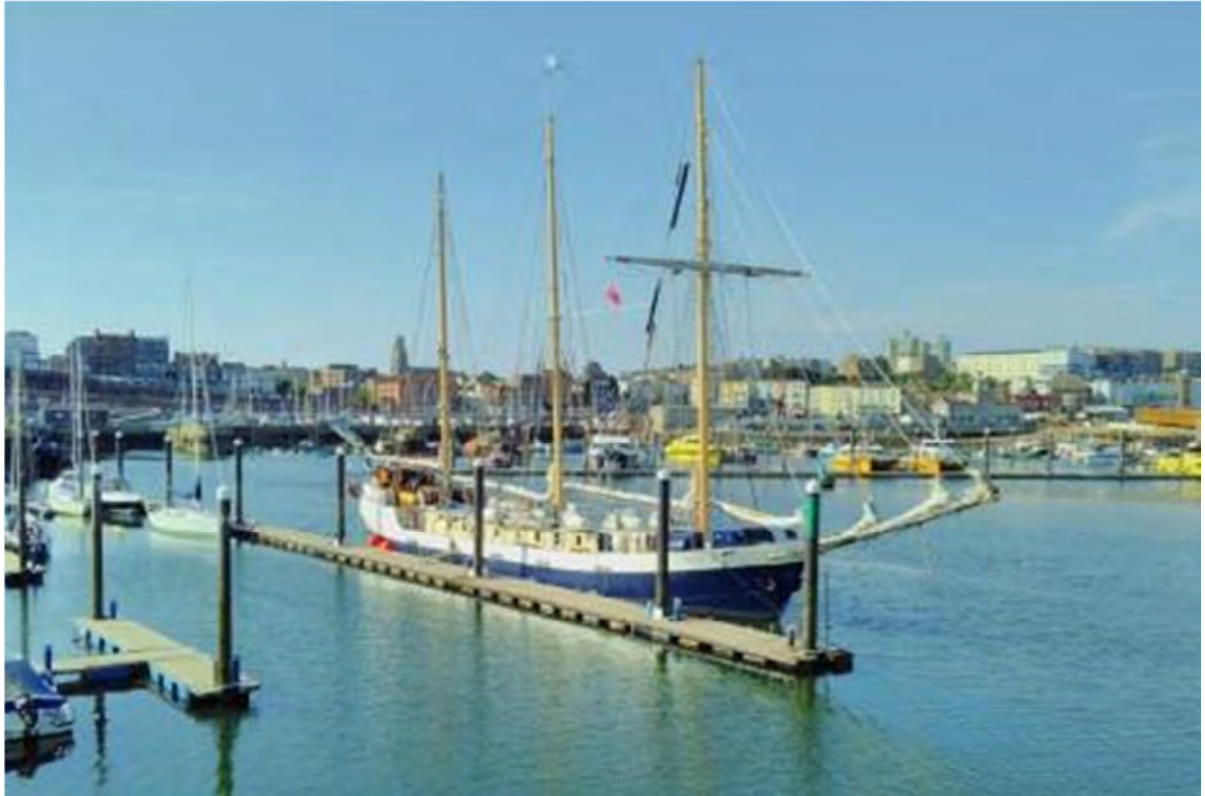
Älva i Ramsgate, i väntan på att klassen skall komma tillbaka

Väl tillbaka på båten var det dags att kasta loss, förbereda seglen och bege oss mot Nederländerna. Till en början var allt lugnt och det gick strålande trots att solen inte sken. Efter redan en halvtimme börjades det kännas i magen på de flesta. Även fast vågorna inte var så jättestora hade relingen alltid sällskap hela natten lång.