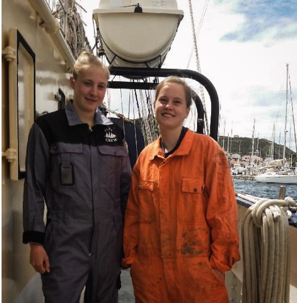
Glada elever hjälper till med underhåll