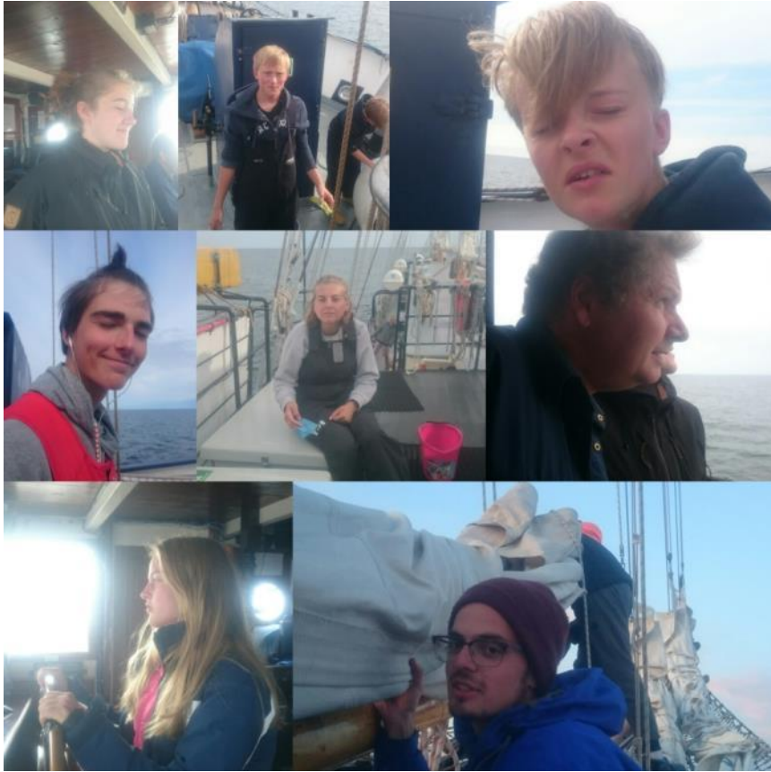
Sista 8-12 vakten på denna