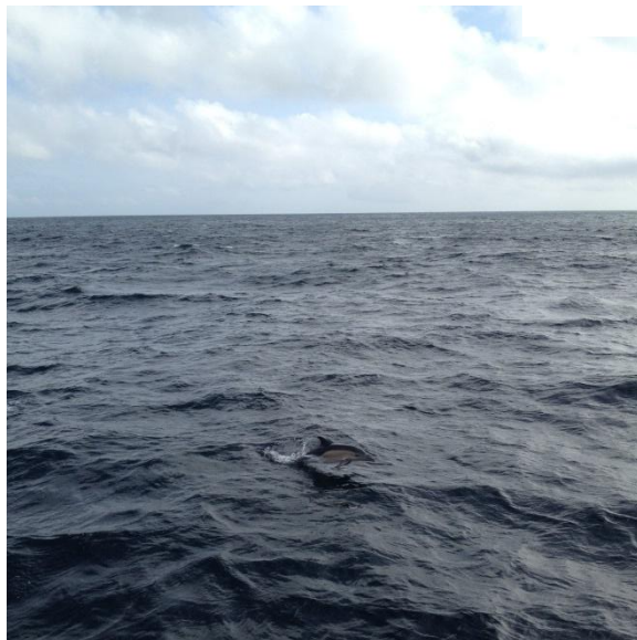
Vårt sällskap idag.