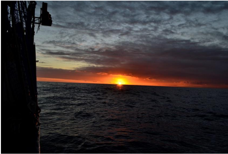
En bra start på dagen